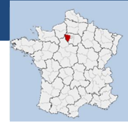
Lieu : LE VESINET (78)

Maitre d'Ouvrage : Grand Paris Aménagement