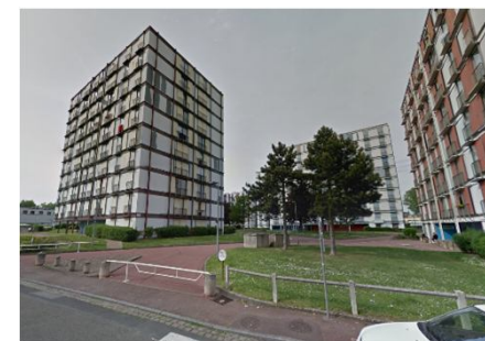
Photographie de l'existant