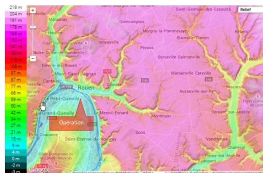
Extrait de la carte topographique Etat initial DLE