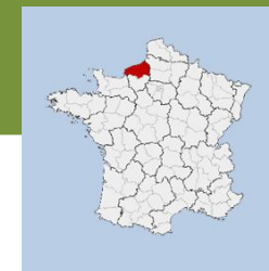
Lieu : Rouen (76)