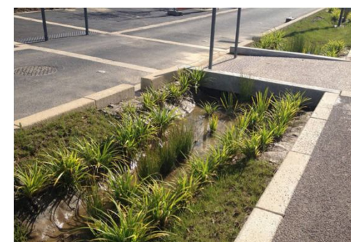
Exemple de mesure compensatoire – Noue d'infiltration en milieu urbain