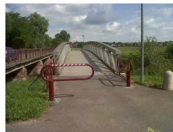
Vue de la piste cyclable