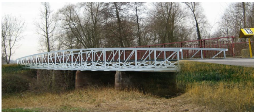
Intégration de la passerelle projetée dans le site