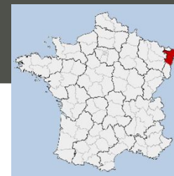
Lieu : GEUDERTHEIM (67)