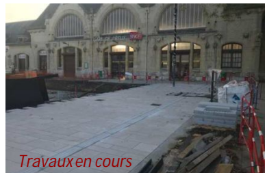
Travaux en cours