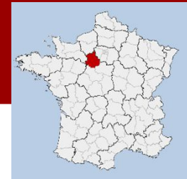
Lieu : DREUX (28)